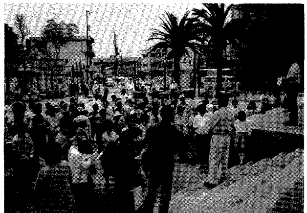
第2図. 神戸市長田区鷹取地区の大国公園で。1995年5月28日。