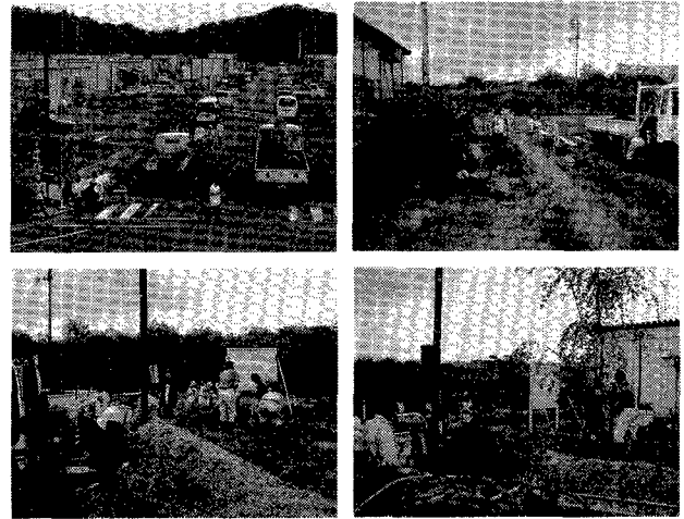
第6図. 中越大震災後のガレキ隊の活動.

新潟県中越地震のあと、山古志村の人々のために建てられた仮設住宅。そこに兵庫県と神戸市から提供された花の種をまき、花苗を植え、仮設住宅の入口にはシダレザクラとヤマボウシの2本の木を植えました。その日は、山古志村の人々が田植えの準備のために地震後初め