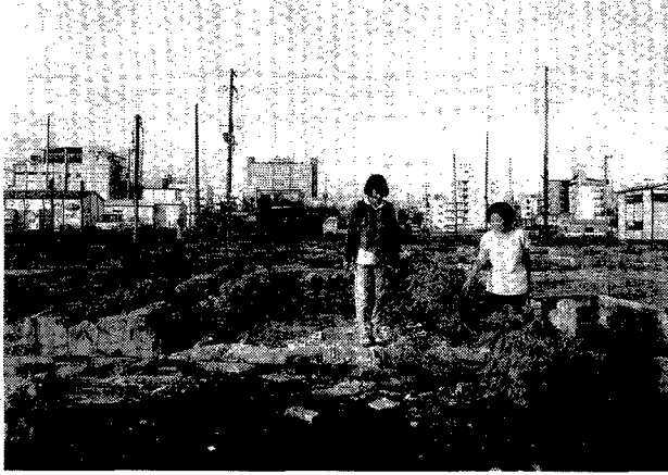
第3図. 神戸市長田区鷹取地区海運町の花のライン。 1995年7月18日。

跡、長田区大道などにはコスモス、ヒマワリの他、15種混合の種もまきました。長田区大道の職住混合の町工場跡地では、住宅の1階の工場床がコンクリートだったので、削岩機で植え穴を作りながらヒマワリの種子をまきました。