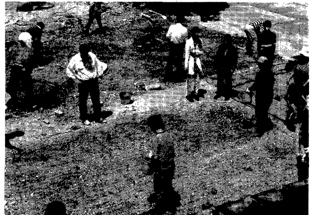
第1図. 神戸市灘区楠丘町で種まき。1995年5月27日。