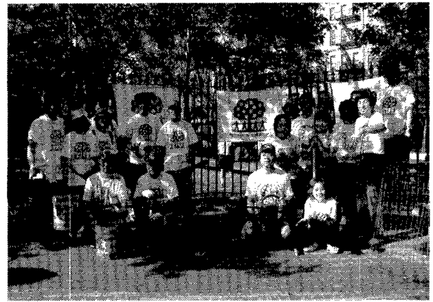
第5図. New Yorkのガレキ隊。2002年5月。

は限界を感じるようになり、造園の専門家達の緑花支援ネットワークとして「阪神グリーンネット」を発足させることになりました。